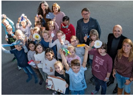
Gemeinsam kreativ: die Klasse 4 der Christoph von Schmid-Schule bei der Vorarbeit für den virtuellen Kalender.

Oberstadion – Christoph von Schmid, zugleich römisch-katholischer Priester und Schriftsteller, gilt als erfolgreichster Kinder- und Jugendbuchautor seiner Zeit. Seine Werke wurden in 25 Sprachen übersetzt und durch die Auswanderung vieler Deutschen wurden seine Büchlein in alle Welt hinausgetragen. Der Verfasser des Weihnachtsliedes „Ihr Kinderlein kommet“ und weiterer bekannter Kirchenlieder war von 1816 bis 1827 Pfarrer von Oberstadion.